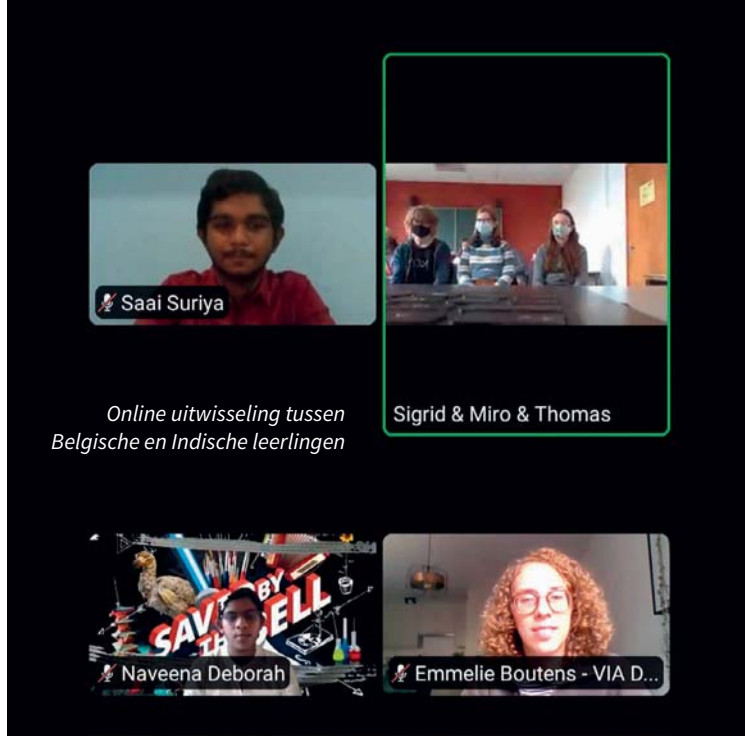
Online uitwisseling tussen Belgische en Indische leerlingen