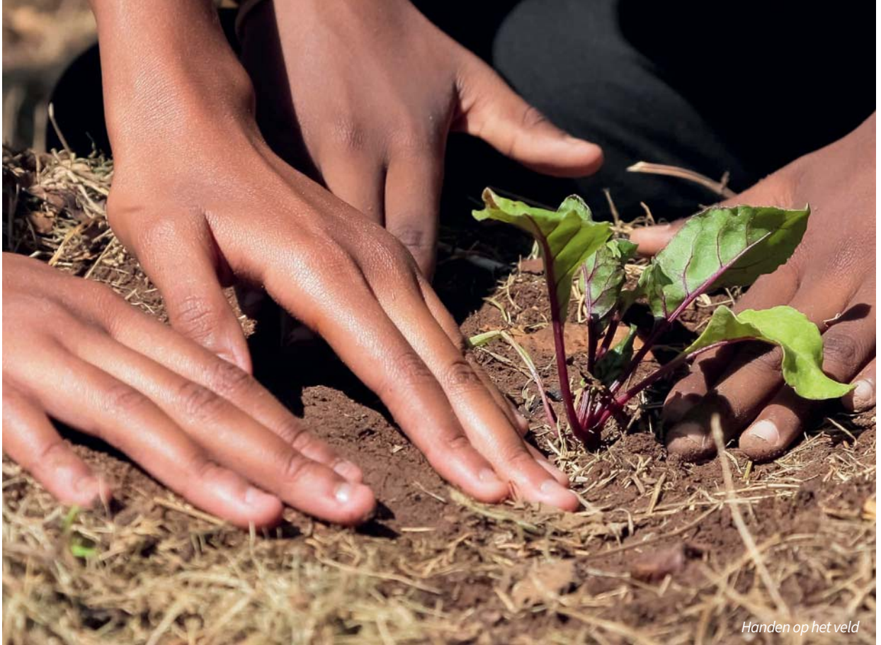
Handen op het veld